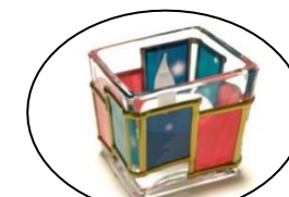
② キャンドルホルダー