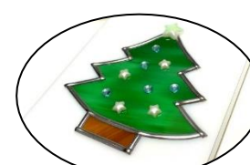
① クリスマスツリーの鏡